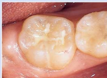
シーラント処置歯