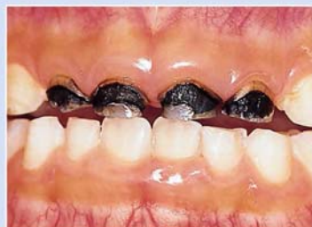
サホライド塗布歯 (C)